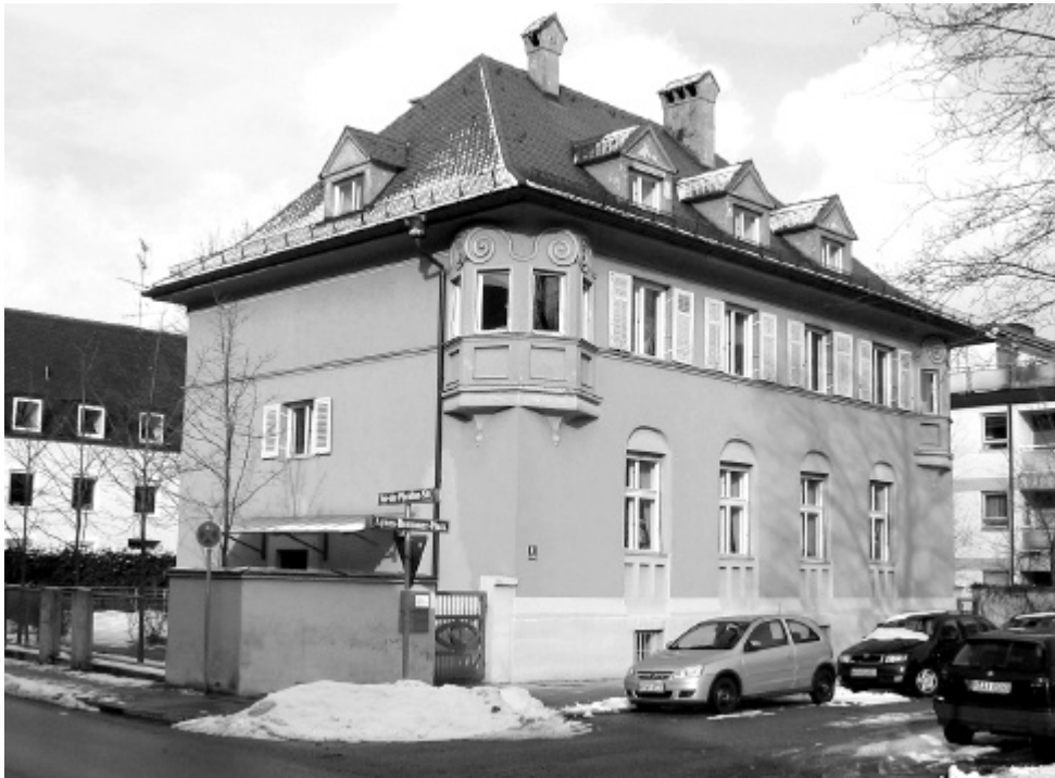
Neue Heimat für PRO BAHN