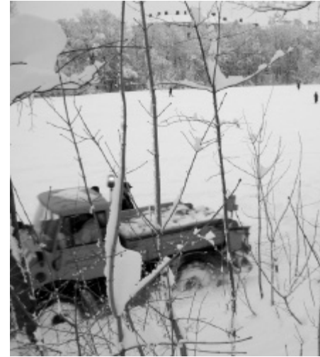
Schneepflug räumt Isar-Radweg

Zugestanden: Nicht alle Fehler waren der MVG anzulasten. Niederflurfahrzeuge sind schneeanfälliger als herkömmliche. Und wenn die Räumdienste den Schnee auf die Gleise kippen, hat auch derbes Räumgerät es schwer. Aber es ist die selbe Stadt, die das zu verantworten hat. Statt dessen war man stolz darauf, dass der