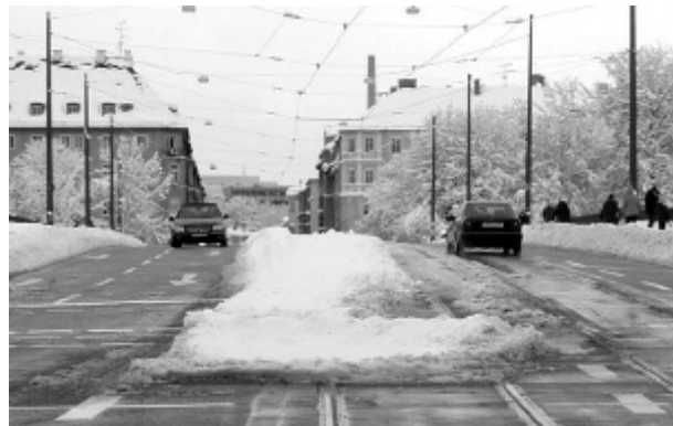
Gleiskörper als Schneeablage (Reichenbachbrücke)

„Geiz ist geil“, aber nicht der Geiz der Endkundschaft, sondern der MVG. Unvermeidlich bricht der Betrieb zusammen, wenn man nicht die Mittel für solche Fälle vorhält. Heutzutage wird betriebswirtschaftlich gedacht; der Ausfall von ein paar Tagen ist eben billiger als ein ganzes Jahr lang Betriebsmittel und Personal zu unterhalten. Die MVG rühmt sich eines hochmodernen Gerätes, das auf Schiene und Straße verkehren kann. Aber offensichtlich ist es nicht genug; in einer Landschaft, wo hin und wieder ein Winter vorkommt, braucht man einen entsprechend umfangreichen Räum-Fuhrpark. Früher haben wir uns über die USA lustig gemacht, wo jedes Jahr der Verkehr zum Erliegen kommt, wenn es völlig überraschend einmal schneit. Inzwischen haben wir viele schlechte Gewohnheiten des Wirtschaftens von dort übernommen und blamieren uns selbst ebenso gut. Es gibt so viele Arbeitslose; konnte man nicht einige davon schnell zum Schneeräumen rekrutieren? Nein; denn so spart man Geld im eigenen Haus, die Folgekosten für die Allgemeinheit kümmern da nicht. Traurig.