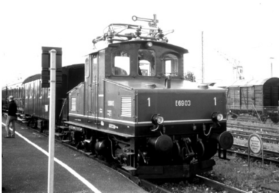
E69 in Nördlingen